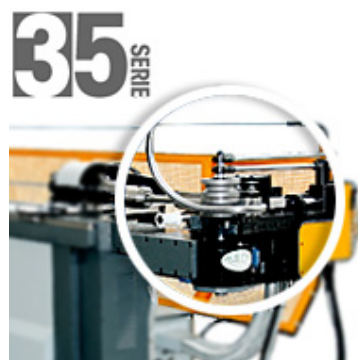
Curvadora de tubo Serie 35: